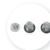
Filtros de sucção