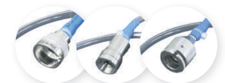
Conexões para testes de vazamento para todas as marcas de endoscópios