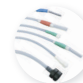
Kits de tubos para todas as marcas de endoscópios